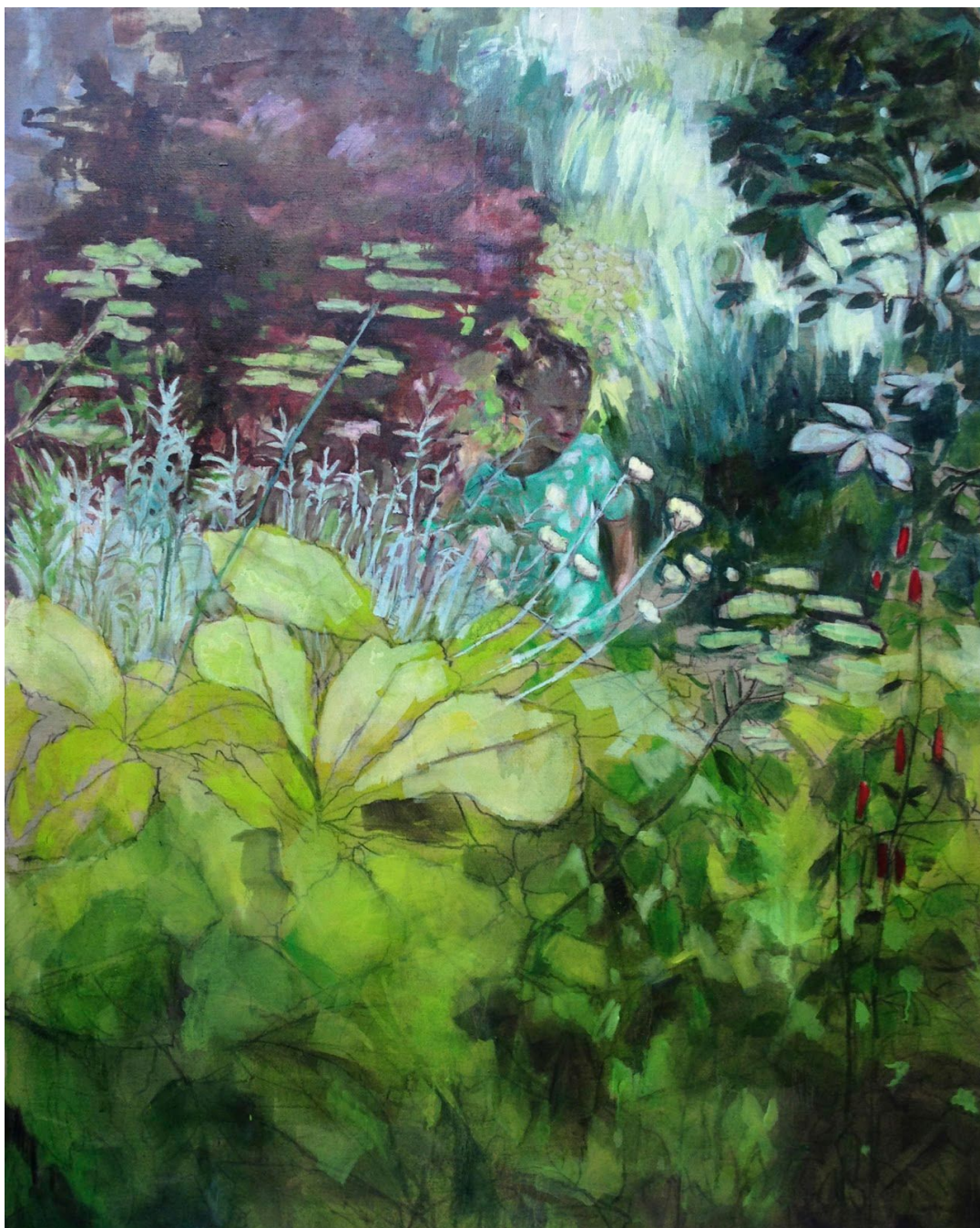
Les herbes folles 2 - 2020 huile sur toile - 162 x 130 cm

exposition personnelle de Sandrine Rondard du 4 au 26 septembre 2020 vernissage prévu le jeudi 3 septembre