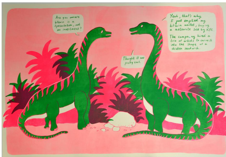
No More Bitcoins - Lithographie sur papier Simili-Japon, 64 x 96 cm, 2018.

Texte de Jean-Michel ALBEROLA - Nov 2015