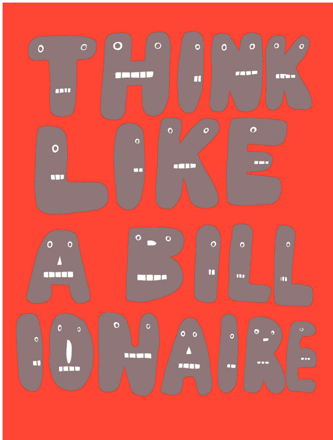
Lithographie sur papier Simili-Japon, 64 x 96 cm, 2018.