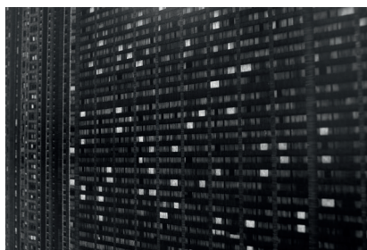
Les monades (détail), 2015. Dessin en carte à gratter et contrecollage sur dibond, 50 x 182 cm.

Dans sa pratique, Amélie Scotta réinterprète les gestes du quotidien et réhumanise les principes mécaniques qui nous régissent et qui ont acquis une forme d'autorégulation. Ainsi, dans Éléphants blancs , des dessins qui s'élèvent à la verticale sur des rouleaux de papier de plusieurs mètres de longueur, elle s'applique à traduire les ombres portées qui viennent rompre la