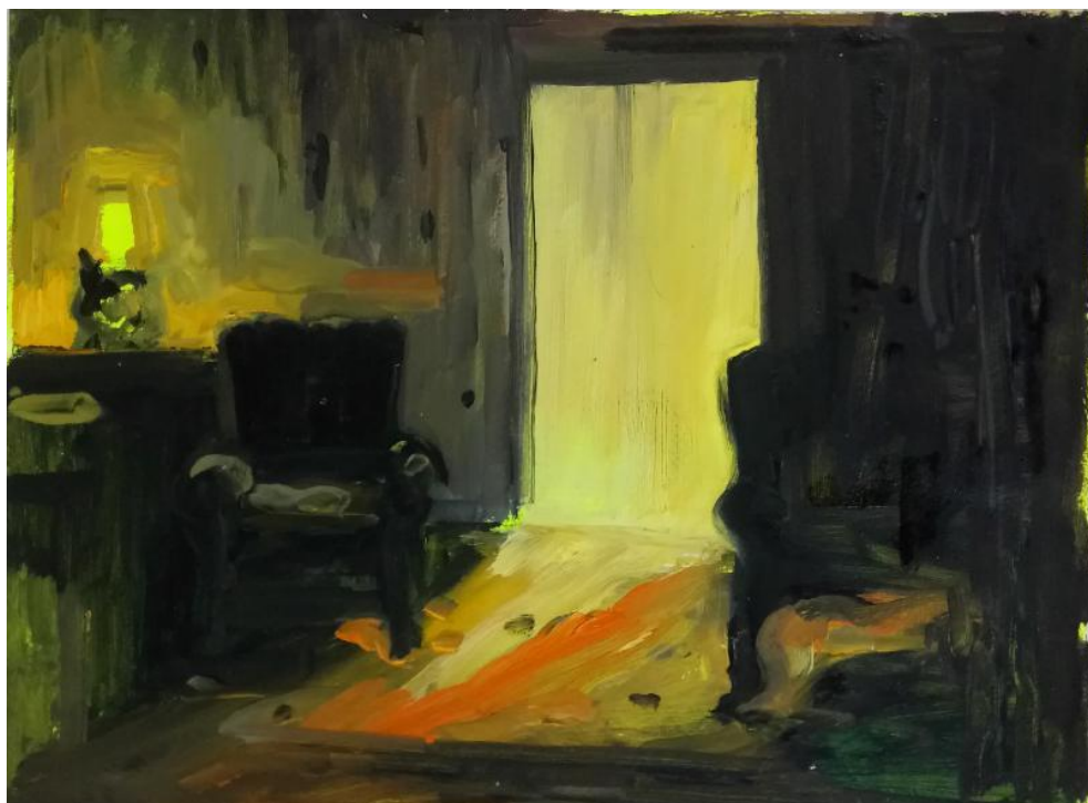
Karine Hoffman Médium- 2016 huile sur papier - 34x24 cm

6 passage des Gravilliers 75003 PARIS P + 6 37 34 99 78 T + 9 83 73 34 64 jeudi - samedi 12h - 19h www.underconstructiongallery.com underconstructiongallery@gmail.com #ucgallery